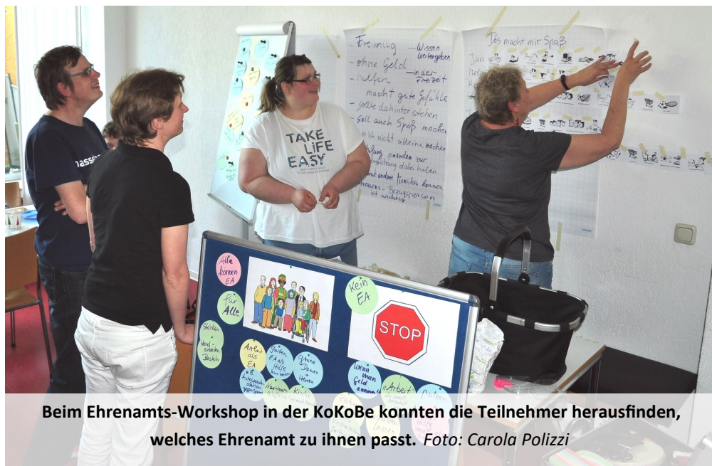
Beim Ehrenamts-Workshop in der KoKoBe konnten die Teilnehmer herausfinden, welches Ehrenamt zu ihnen passt.

Ein weiterer wichtiger Aspekt: Ein Ehrenamt sollte auf jeden Fall Spaß machen. Und was Spaß macht, empfindet jeder anders: „Ich bin gerne