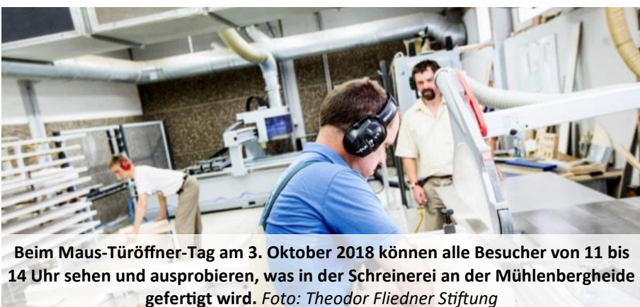
Beim Maus-Türöffner-Tag am 3. Oktober 2018 können alle Besucher von 11 bis 14 Uhr sehen und ausprobieren, was in der Schreinerei an der Mühlenbergheide gefertigt wird.

https://www.wdrmaus.de/extras/tueren_auf.php5