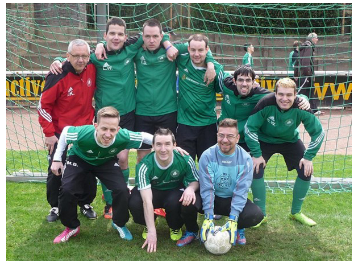
Erster Spitzenreiter der neuen FUBA-Net Liga Saison 2019 ist das Team SC Borussia Hohenlind (Ingo) aus Köln. Der Titelverteidiger sammelte Punkte für den dritten Tabellenplatz. Die Gastgeber aus Mülheim wurden zweiter. Nächster Spieltag ist in Essen am 6. Juli.