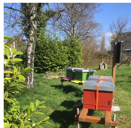
Fleißige Bienen und fleißige Helfer - die Imkerei Spinka unterhält Bienenvölker mit den Bewohnenden von Haus Engelbert.