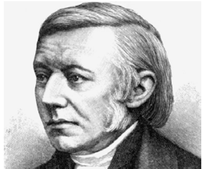
Pfarrer Theodor Fliedner legte mit seinem Werk den Grundstein für die heutige Theodor Fliedner Stiftung.

Mit Pfarrer Theodor Fliedner begann es 1844. Er sah die Nöte der Menschen und wollte nicht nur die unmittelbare Situation ändern, sondern Hilfeleistungen in eine nachhaltige Form bringen, Theodor Fliedner dachte immer einen Schritt weiter. Die Stiftung führt den Gedanken fort, alle schaffen gemeinsam eine Perspektive. Ob es die Suche nach Fachkräften ist, gesetzliche Veränderungen in der Pflegeversicherung oder der Eingliederungshilfe - selten war die gesamtsoziale Situation für Träger herausfordernder. Umso